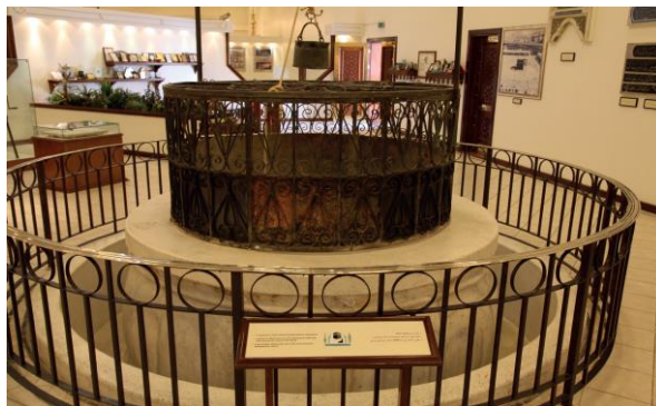
1- شکل: د زمزم تاريخي څاه خوله (د اوبو رايستلو ځای)

د زمزم څاه د سعودي عربستان په مکه مکرمه کې، د کعبې شريفې ختيځ لوري ته 21 m ليرې موقعيت لري. دا څاه چې په 1 شکل کې ليدل کېږي، د انسانانو په لاس کيندل شوي ده او ژوروالي يې شاوخوا 30.5 m او قطر يې له 1.08 m څخه تر 2.66 m پورې رسېږي (Ahmad et al., 2018). د عربو تاريخپوهانو په وينا، د زمزم څاه تقريباً 4000 کاله وړاندې فعال شوی او تر نن ورځ پورې بغير له کومې وقفې گټه ورڅخه اخيستل کېږي. د اسلامي عقيدې له مخې، دا څاه د الله تعالی د رحمت نښه ده. روايتونه وايي، چې کله حضرت هاجر، د حضرت ابراهيم عليه السلام مېرمن، له خپل زوی حضرت اسماعيل عليه السلام سره د سختې تندې له امله د اوبو په لټه کې وه، نو الله جل جلاله جبرائيل عليه السلام راولېږه، چې د ځمکې خاوره وڅنډي او له هغه ځايه د اوبو يوه چينه راوتوکېږي. د اوبو له بهېدلو سره، حضرت هاجرې، د هغې چاپېره د شگو او ډبرو يو کاسه نما ديوال جوړ کړ، ترڅو اوبه مهار او کنترول کړي (Al-Zuhair & Khounganian, 2006). د صحيح البخاري روايتونه څرگندوي، که حضرت هاجرې دا چينه نه وای مهار کړې، نو بنايي دا اوبه به د ځمکې پر مخ يوه بهېدونکې وياله گرځېدلې وای. مور مسلمانان باور لرو، چې دا الهي چينه د حضرت اسماعيل عليه السلام د لورې، تندې او ژړا پر مهال را څرگنده شوې ده. ځينې روايتونه دا هم وايي چې حضرت اسماعيل عليه السلام د ځمکې پر مخ پښې ووهلې او د همدې ځای نه د زمزم اوبه راوتوکېږي (Shomar, 2012).